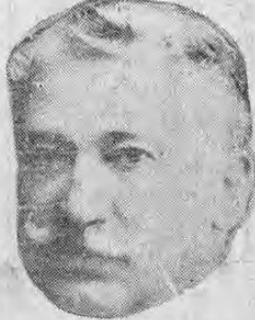
DON JULIO ACOSTA G.

Para nosotros siempre es muy grato cambiar impresiones con el ex-presidente de la república don Julio Acosta, amigo por quien sentimos singular aprecio en esta casa de LA TRIBUNA, de la cual es uno de sus más distinguidos colaboradores. Sabe el considerar nuestros problemas con visión y con entereza y es por esto que sus declaraciones tienen siempre gran interés. Ayer, que lo encontramos camino del congreso, lo detuvimos unos momentos para preguntarle: —Que nos dice usted, don Julio, acerca del proyecto de presupuesto que la secretaría de hacienda ha en viado al congreso? —Con la gentileza que le distinguo, don Julio me hizo las siguientes importantes declaraciones: —Ya en varias ocasiones he dado en globo mi opinión, no porque tenga empeño en dar opiniones sobre esto, sino porque me ha sido pedida. Estoy dispuesto a aprobar ese (PASA a la Pág. 5, Col. 1)